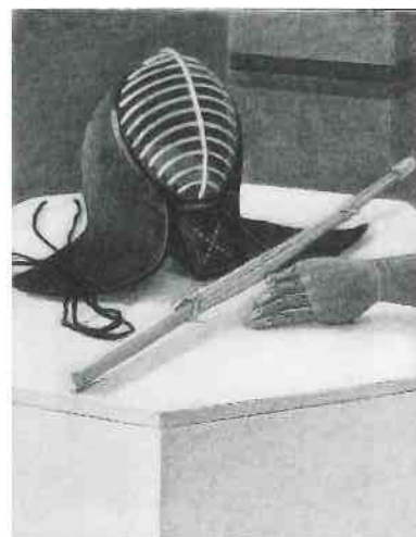
大人の写実絵画コース(夜間クラス)受講者 木炭デッサン 2021年