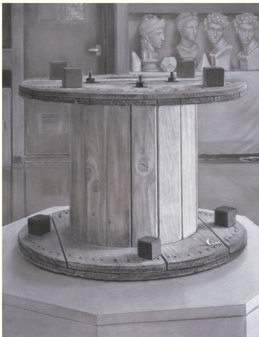
大人の写実絵画コース（昼間クラス受講者） 白チョークデッサン 2024年