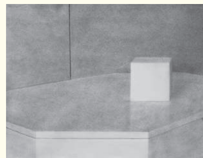
画家育成コース受講者 木炭デッサン2025年